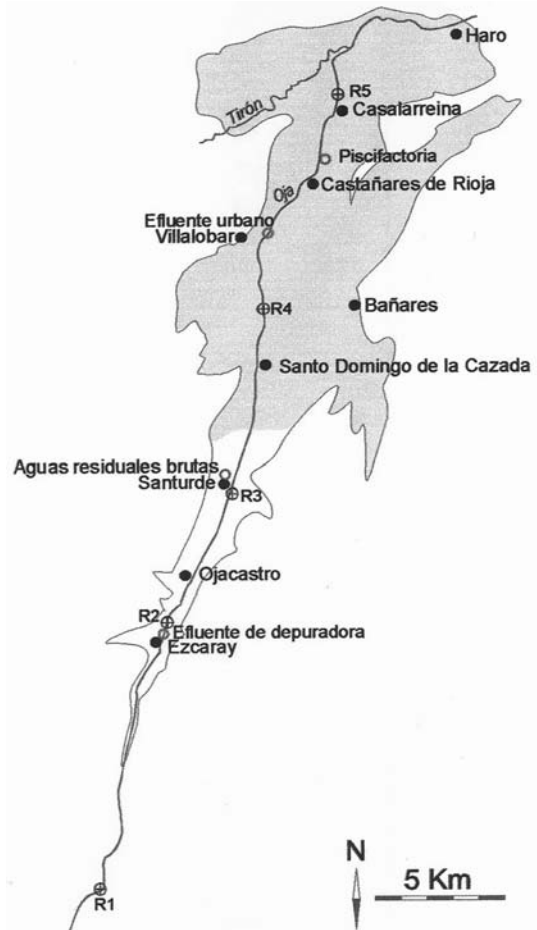
Figura 1. Mapa de la Unidad Hidrogeológica 09-04-03. Situación del río Oja, de las estaciones de muestreo y de los puntos de impacto que afectan al sistema. En gris: agricultura de regadío. Map of the Hydrogeological Unit 09-04-03. Location of the Oja River, the sampling stations and the impact points that affect the system. In grey: irrigation agriculture.

En este estudio, se ha hecho uso del índice IBMWP para diagnosticar la calidad ambiental